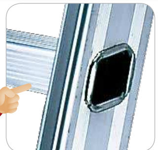
Pioli a rombo 30x30 mm inclinati a 68°