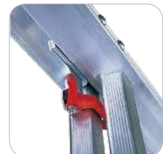
Arresti anti sfilo montati sui ramponi di aggancio (EN131)