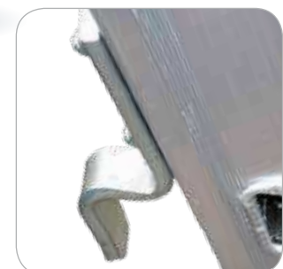
Ramponi in acciaio fissati ai montanti con viti passanti