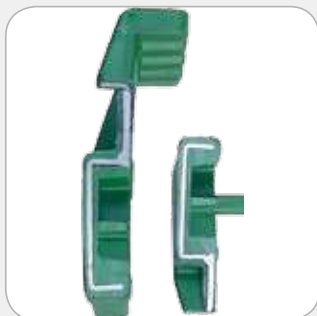
SICUREZZA: Anima d'acciaio ricoperta