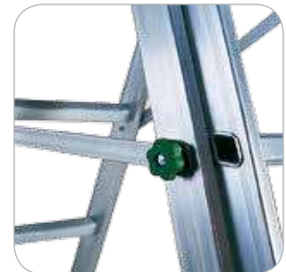
Forti barre anti chiusura ed anti divaricamento in alluminio bloccabili ad espansione