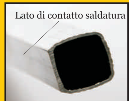
Nuovo gradino asimmetrico