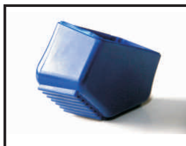
Nuovo tampone ergonomico maggiorato (el. esterno)