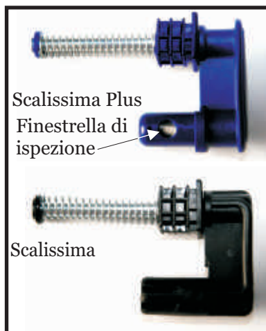
Nuovi ganci di bloccaggio in acciaio Scalissima Plus e Scalissima