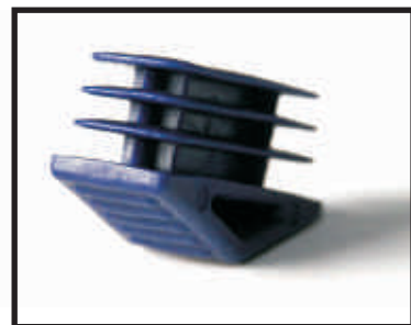
Nuovo tampone ergonomico maggiorato (el. Interno) Solo su Scalissima Plus