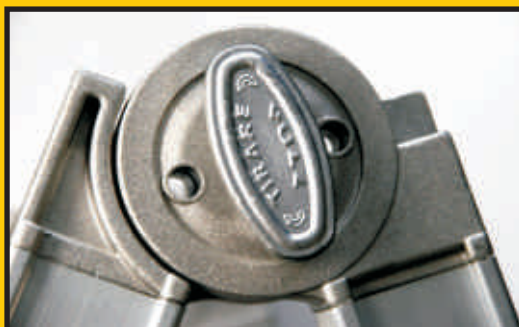
Nuova Cerniera rinforzata in pressofusione con tirante in alluminio