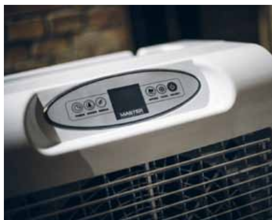
CCX 4.0 Pannello di controllo